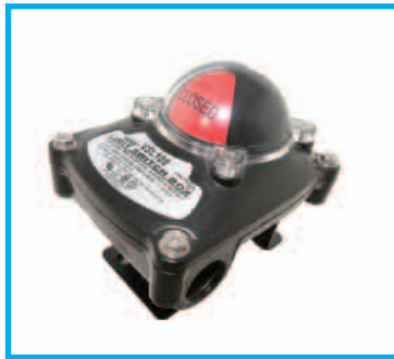
VSL-100系列, 防水型 Weather-proof