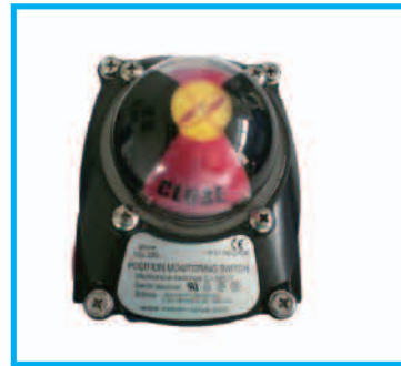
VSL-200 系列, 防水型 Weather-proof